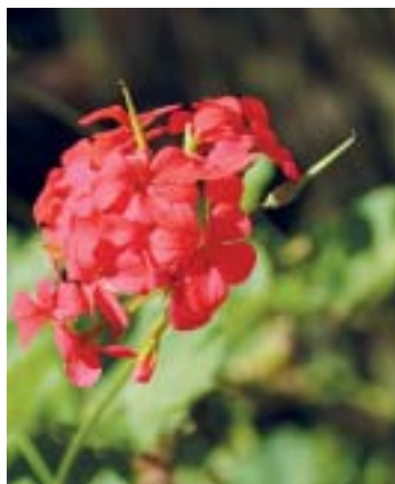
GERÂNIO (nome científico: Pelargonium hortorum )