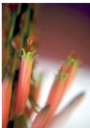
ALOE (nome científico: Aloe vera )