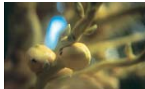
COCOS (nome científico: Cocos nucifera )

Solicite a junção de todos os florais em um único frasco âmbar de 30ml e tome 8 gotas duas vezes ao dia, por 3 meses.