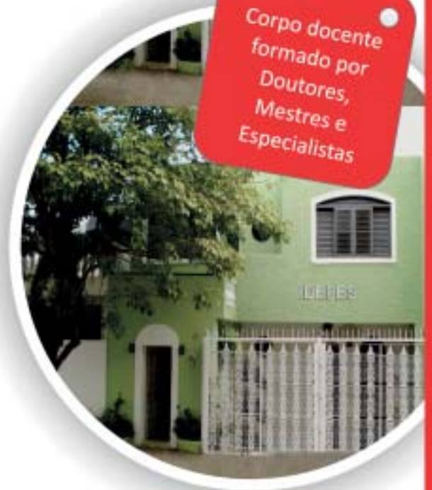
IDEPES - Instituto de Desenvolvimento Pessoal de Ensino Superior

Corpo docente formado por Doutores, Mestres e Especialistas